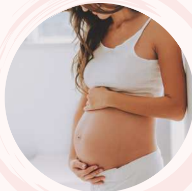
Autour de la future maman