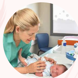
Auxiliaires de puériculture