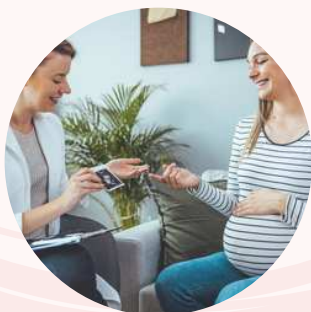
La coordinatrice maternité

D'autres professionnels de la clinique sont aussi présents tout au long de la prise en charge de la future maman : le personnel soignant et médico-administratif, une psychologue , un ostéopathe , kiné et une conseillère en lactation .