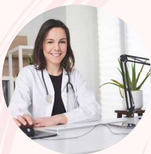
Les gynécologues obstétriciens